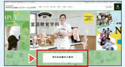
※画像は、専門学校北海道リハビリテーション大学のTOPページです。